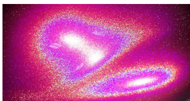
サンシャインレッドベース

この度は Phantom Aurora Space マイクロボトルをお買い上げ頂きましてありがとうございます。 下記マニュアルをよくお読みになりご使用下さい。